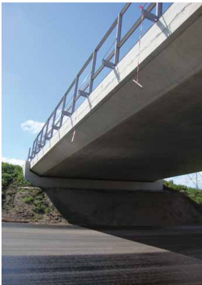
Viaduct bij Halsteren