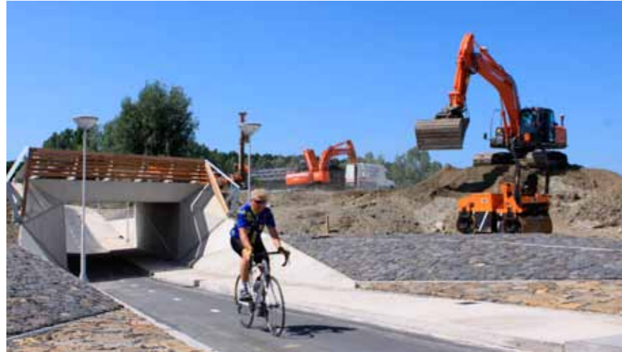
Fietsers door fietstunnel bij Gapingseweg

Elk jaar verzorgt het Routebureau Zeeland o.a. fietsroutes door Zeeland. Door de werkzaamheden aan de nieuwe N57 maakt Rijkswaterstaat er een flinke puzzel van.