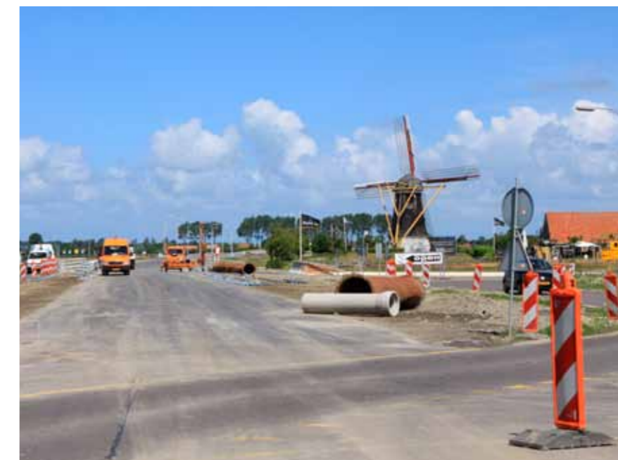
Nieuwe N57 ter hoogte van de Molen

Voor de werkzaamheden aan het Veerse deel van de N57 komt het einde nu snel in zicht. Het is u waarschijnlijk al opgevallen dat er veel veranderingen te zien zijn. Zo is de hoofdrijbaan N57 langs Serooskerke richting Vrouwenpolder begin juni al grotendeels geasfalteerd. Vanaf de rotonde Vrouwenpolder richting de Veersedam is de hoofdrijbaan opengesteld en wordt er al volop gefietst door de nieuwe tunneltjes.